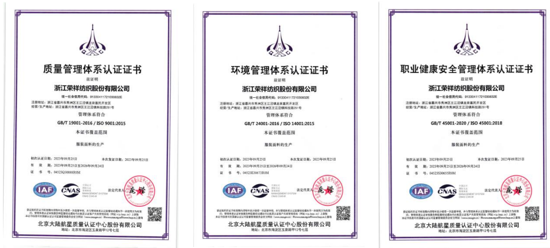
管理体系认证证书

业务团队。公司通过完善管理制度、规范从业道德、培养全员素质、以以诚为本、务实创新的经营理念，立志成为高品质的全球纺织面料供应商。